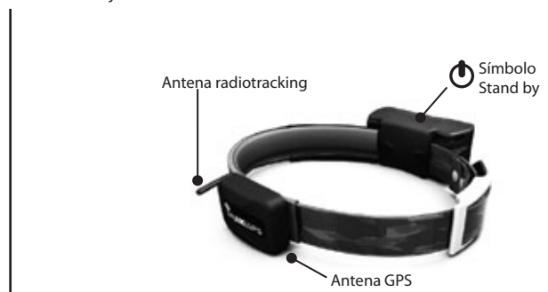
Figura 1.b vista desde abajo